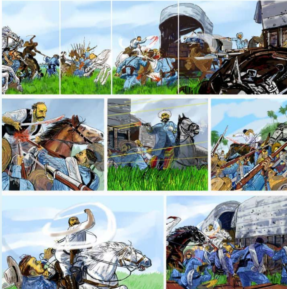
ILUSTRACIÓN: PEDRO LUIS POMARES